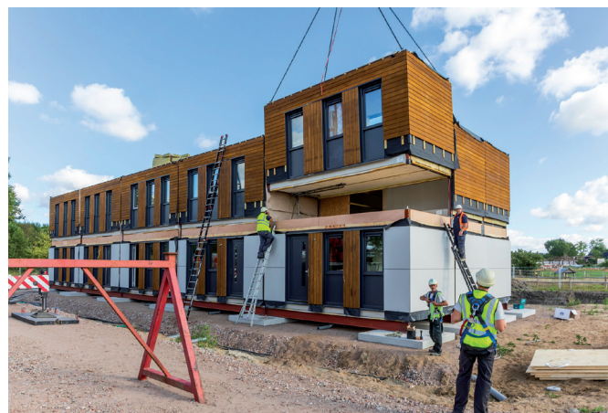
Bouw tijdelijke woningen

Tijdens de presentatie over de dorpenaanpak op 9 juni hebben wij u verteld over de bouw van de 18 tijdelijke woningen aan de Hoeksmeersterweg. De wisselwoningen worden in december 2022 opgeleverd. Veel bewoners willen graag binnen Garrelsweer verhuizen naar hun tijdelijke woning en dat begrijpen wij heel goed! Voor de bewoners van de eerste woningen die nu versterkt worden, hebben wij naar alternatieven voor tijdelijke huisvesting gezocht. De wisselwoningen die wel voor hen beschikbaar waren, staan in Loppersum en Ten Post. Hier zijn de bewoners mee akkoord gegaan en daar zijn we hen erg dankbaar voor. Zo kon de versterking van hun woningen toch beginnen.