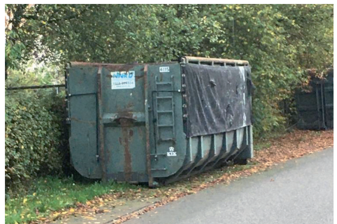
Container voor huisraad

Asbest, groenafval, bouw- en sloopafval of restafval bestemd voor de grijze container valt niet onder grofvuil. Dit moet u op de gebruikelijke manier afvoeren. Meer informatie hierover vindt u in de gemeentelijke afvalwijzer en op www.eemsdelta.nl/afval .