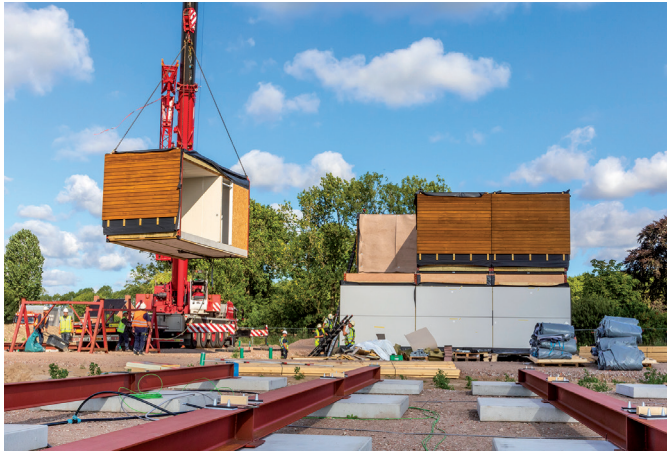
Bouw tijdelijke woningen