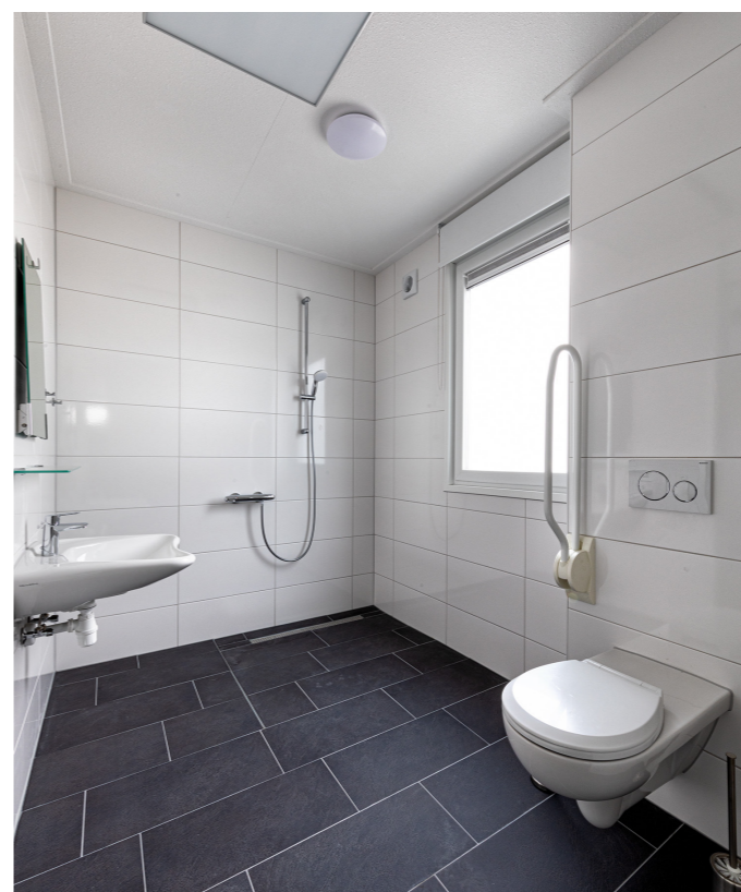
Foto's tijdelijke huisvesting mindervaliden